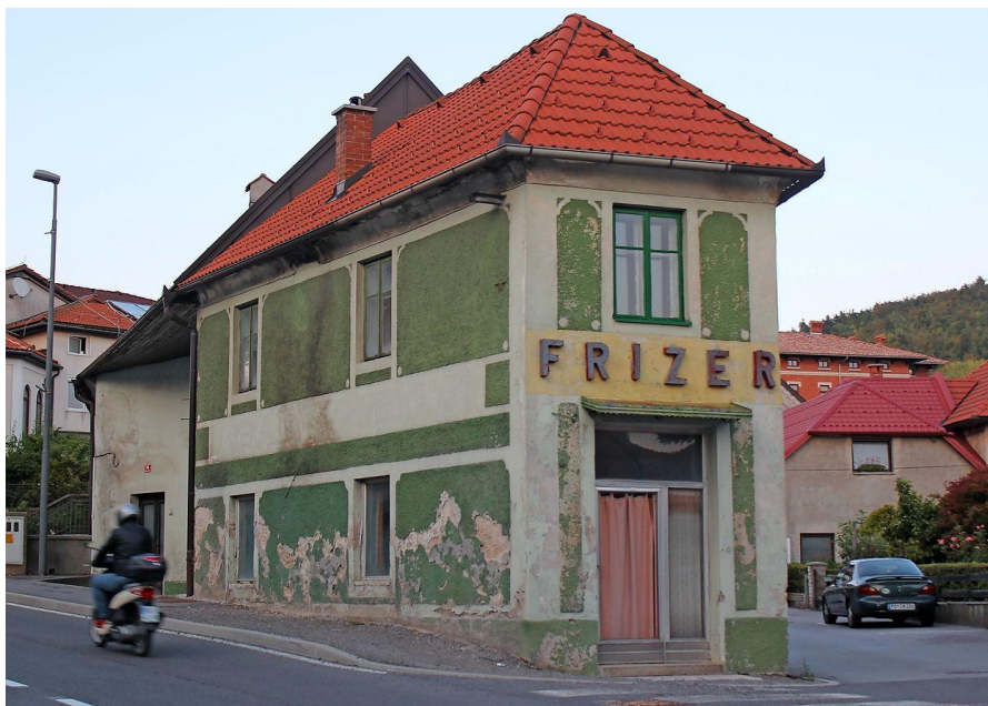
Slika 9: Prvoten izgled salona Ozbič

Frizerski salon Ozbič je najstarejši v mestu Postojna. Svoja vrata odprl že leta 1924 in je enako podobo ohranil do leta 2019, ko so ga preuredili v živi muzej, kjer je del posvečen tudi udi razstavi o lastniku Janku Ozbiču, ki je v stavbi strigel do svojega 89 leta. (odseka ni v aplikaciji TZS)