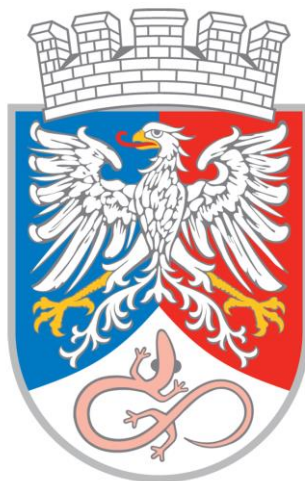
Slika 2: Grb Postojne