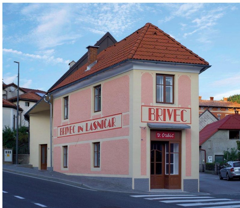
Slika 10: Prenovljen salon Ozbič