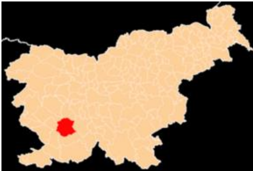
Slika 1: lega Postojne

Mesto Postojna meri 270 km 2 . Leži v jugozahodnem delu Slovenije na nadmorski višini 556,4 m in spada v Primorsko-notranjsko regijo. Nahaja se na območju ki je bogato s Kraškimi pojavi ter naravno in kulturno dediščino, gospodarsko pa je prvenstveno usmerjeno v turizem. Več kot 60% občine pokriva gozd, zato prevladuje lesna industrija, velik del občine pa obsega Poček, ki je osrednje vadišče slovenske vojske.