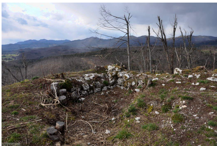
Slika 4 : Grad Adelsberg