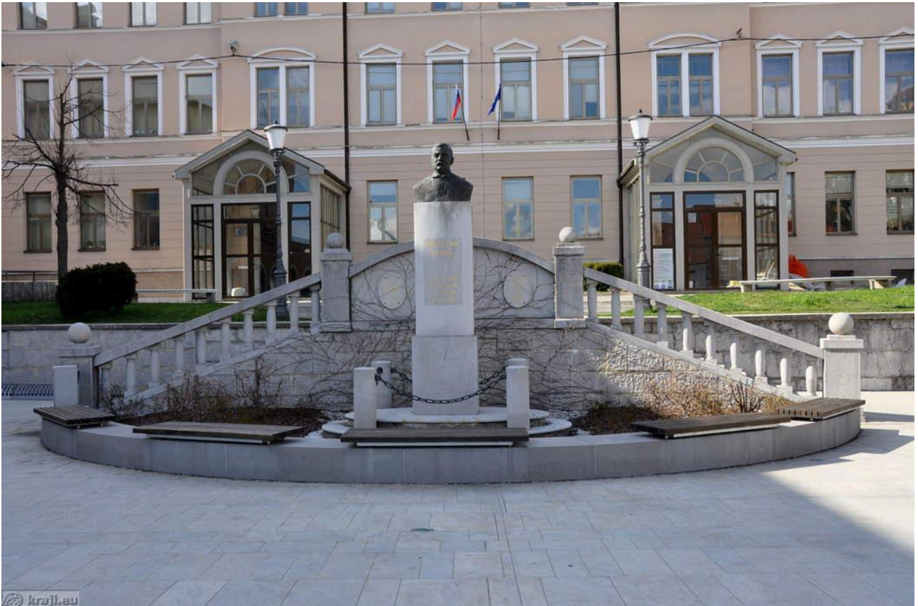
Slika 15: Spomenik Miroslavu Vilharju

Miroslav Vilhar se je rodil v bližini Postojne v začetku 19.stoletja. Bil je skladatelj, pesnik, narodni buditelj, dramatik in izdajatelj političnega lista Naprej. V Postojni so mu postavili spomenik, ki so ga fašisti povsem porušili. Leta 1995 so ga ponovno postavili pred Osnovno šolo Miroslava Vilharja. (odseka ni v aplikaciji TZS)