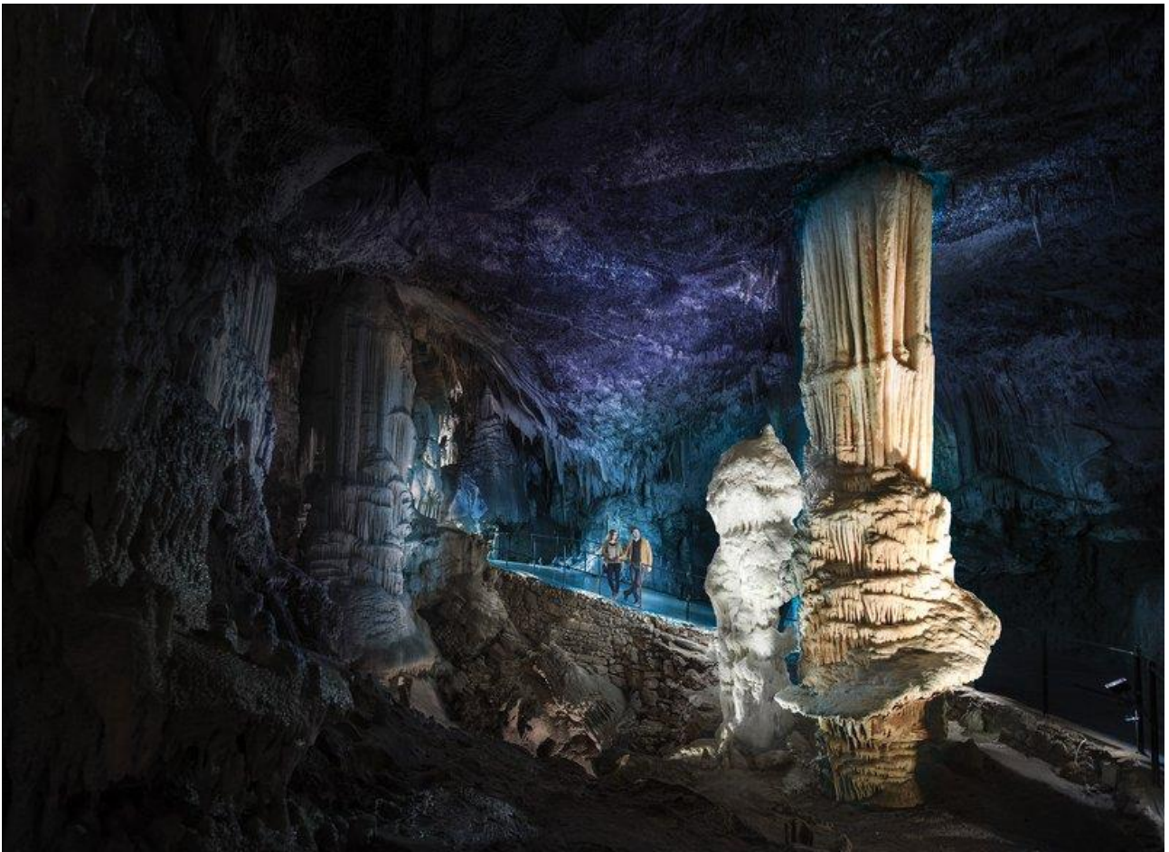
Slika 17: Postojnska jama