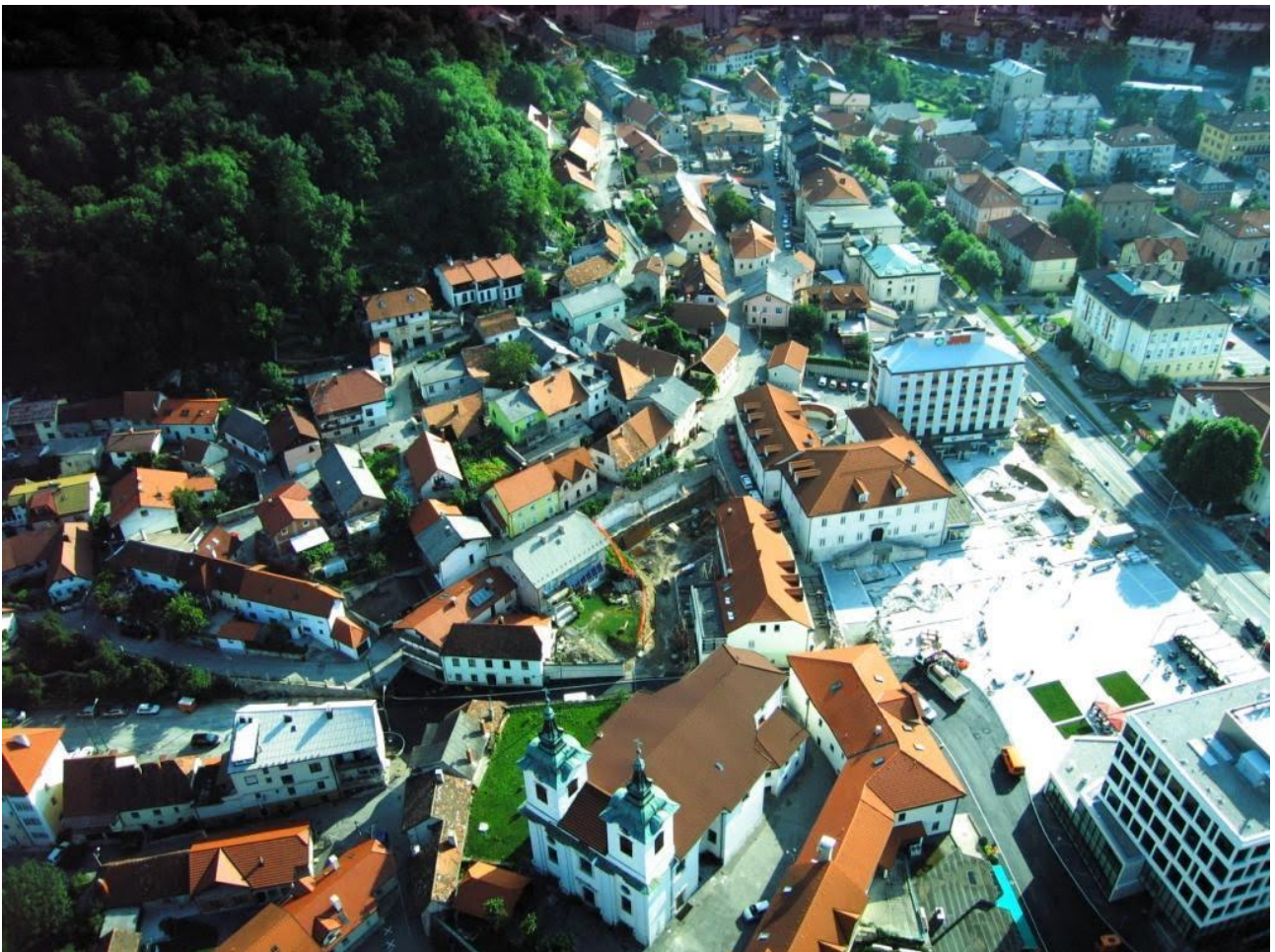
Slika 13: Majlont

Majlont je staro mestno jedro Postojne, ki leži pod hribom Sovič. Prepoznaven je po ozkih ulicah in strnjeni pozidavi. Skozi zgodovino je bilo mestno jedro zaradi načina pozidave in gradnje večkrat uničeno v požarih, vendar vsakič znova obnovljeno, celovito obnovljen pa je bil med letoma 2011 in 2012. Zanimivo je da domačini pravijo, da ima vsaka hiša in vsaka ulica Majlonta svojo zgodbo. Izvor imena Majlont sicer izhaja iz 19.stoletja, ko so na tem delu živeli delavci iz Milana, v tistem času pa so Nemci prevedli Milano v nemški jezik in tako je nastal izraz Majland oz. popačeno Majlont. (odsek je v aplikaciji TZS)