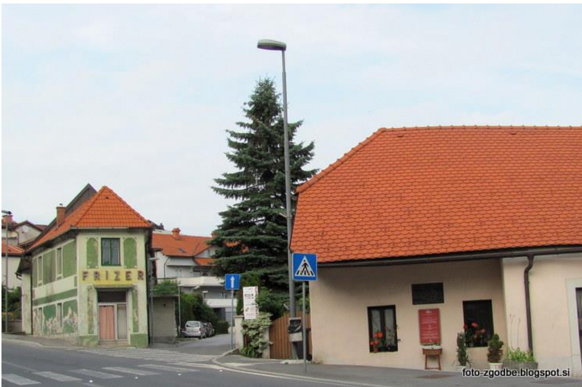
Slika 11: Rojstna hiša Luke Čeča