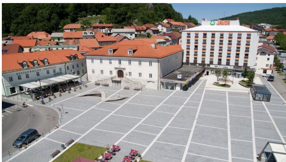
Slika 7: Titov trg

Na Titovem trgu je postavljena tudi skulptura človeške ribice, na kateri so navedeni pomembnejši dogodki v zgodovini Postojne (odsek je v aplikaciji TZS).