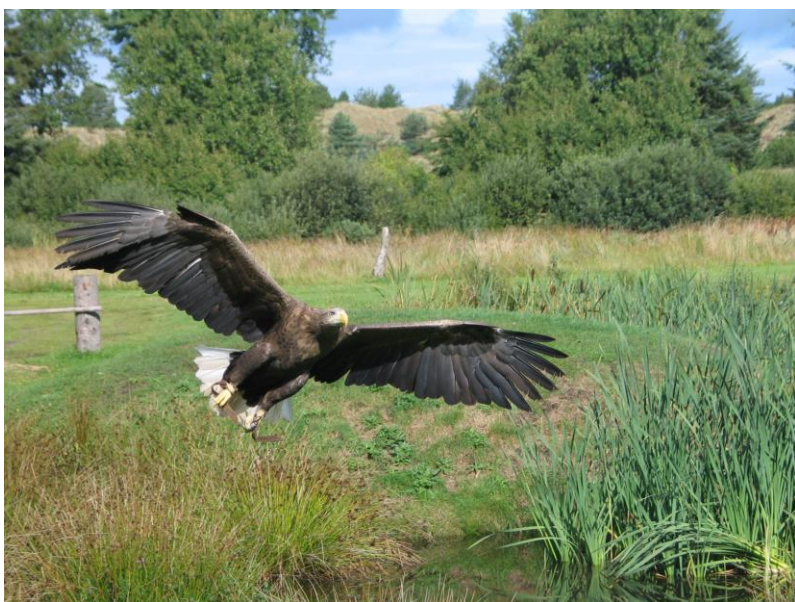
Slika 3: Postojna oz. Orel Belorepec

Postojna ima zaradi svoje lege zelo bogato zgodovino, ki sega že v obdobje paleolitika, iz katerega so v Betalovem spodmolu našli kamnita orodja, orožja ter kurišča. Prvič je bila omenjena v 13.stol. kot Arnsberg kar lahko prevedemo kot Orlov hrib. Ime je mesto dobilo po orlu belorepcu imenovanem Postojna, ki je nekoč gnezdil na Soviču, zato se na grbu mesta tudi danes nahaja orel. Sovič je hrib nad Postojno kjer so še danes vidni ostanki gradu, ki je pogorel l.1689 zaradi udara strele.