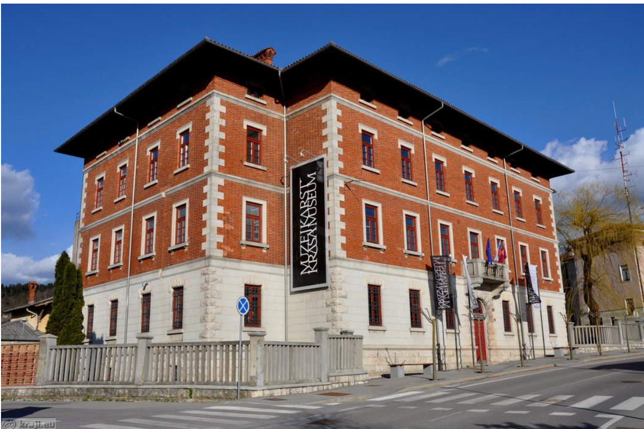
Slika 8: Notranjski muzej

Stavba notranjskega muzeja je bila zgrajena leta 1929 kot italijanska vojašnica za varovanje in ohranjanje Rapalske meje. Po drugi svetovni vojni je bila dom garnizijske komande JLA. Prav zaradi njene bogate zgodovine je bila leta 2007 stavba razglašena za kulturni spomenik. Leta 2011 je stavba postala sedež Notranjskega muzeja. Muzej ima na ogled stalno arheološko, biološko, etnološko in zgodovinsko zbirko, ki pričajo o bogati zgodovini na Krasu. (odsek je v aplikaciji TZS)