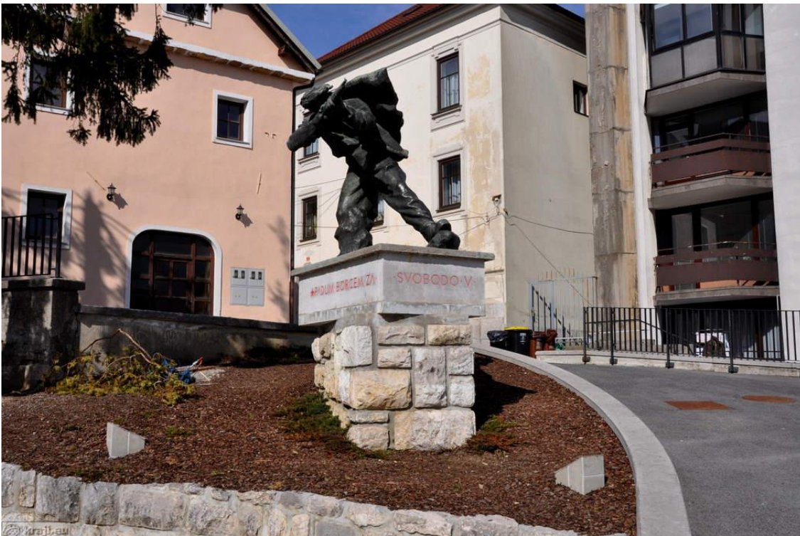
Slika 14: Spomenik NOB