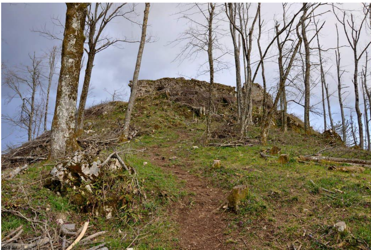
Slika 12: Ostanki gradu Adelsberg

Sovič je 677m visok grič, ki se razprostira nad Postojno. Na njem se je nekoč nahajalo prazgodovinsko gradišče in kasneje rimska utrdba. Danesso vidne le še razvaline srednjeveškega gradu Adelsberg, imenovanega tudi Stari grad, ki je prvič omenjen leta 1228. V 12. stoletju so ga zgradili grofje Andeški, potem pa je prešel v posest oglejskih patriarhov. Kasneje so ga od Ogleja prevzeli Habsburžani, ki so ga nato že v naslednjem letu zastavili Celjskim grofom. Leta 1581 je grad kupil knez Janez Siegfried Eggenberg, leta 1680 pa knez Janez Vajkard Auersperg. Od leta 1856 je grad v državni lasti, zgradba pa je bila med potresom leta 1511 poškodovana. V začetku 17. stoletja pa je vanj treščila strela in ga požgala, dokončno pa je grad propadel med požarom v letu 1689. (odseka ni v aplikaciji TZS)